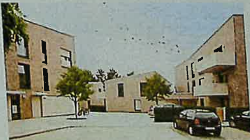
Wohnungsgenossenschaften mit Spareinrichtung trotz den Herausforderungen – und bauen