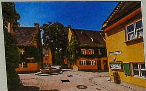
Die Fuggerei in Augsburg gilt als die älteste Sozialsiedlung der Welt. Kann sie heute noch als Vorbild dienen?