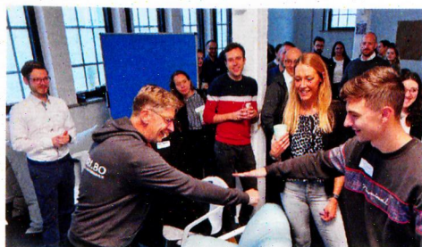
Die Digitalisierung der Wohnungswirtschaft gewinnt durch Initiativen wie das 2020 gegründete Kompetenzzentrum DigiWoh an Tempo