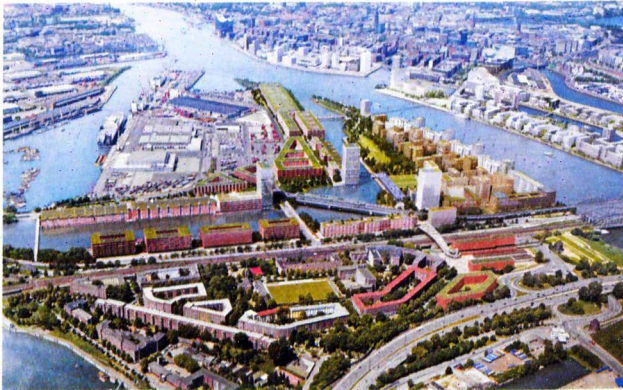
Bauen im Hafen: südlich der Elbe in Hamburg sollen auf dem Grasbrook bis etwa 2030 Wohnungen für 6.000 und Arbeitsplätze für 16.000 Menschen entstehen