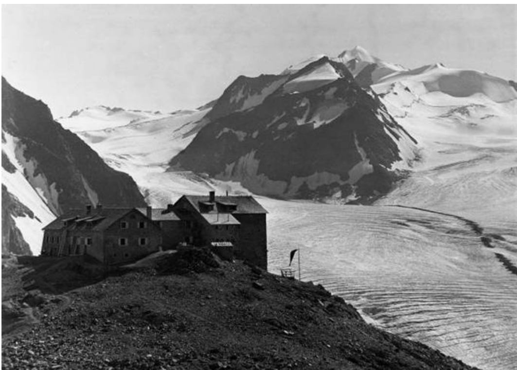
Gebirgslandschaft in der Umgebung der Braunschweiger Hütte, in der Illustrierten „Über Land und Meer“ (1893, Ausschnitt) und im Foto (um 1930, ÖAV Archiv)