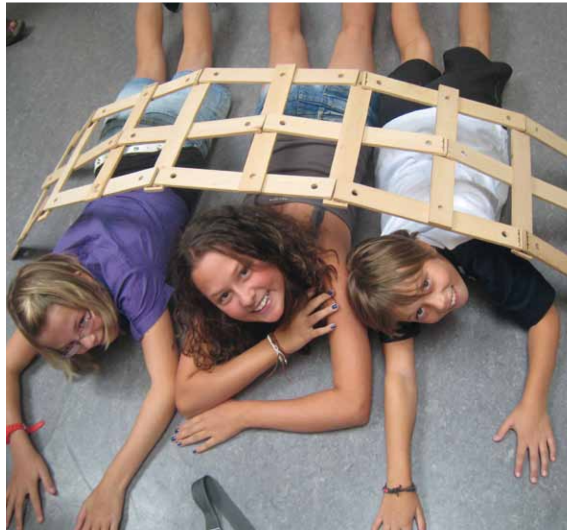
Impressum: © 2013 - BfÜ, Silvia Prock, Grafische Gestaltung: Melanie Staffner