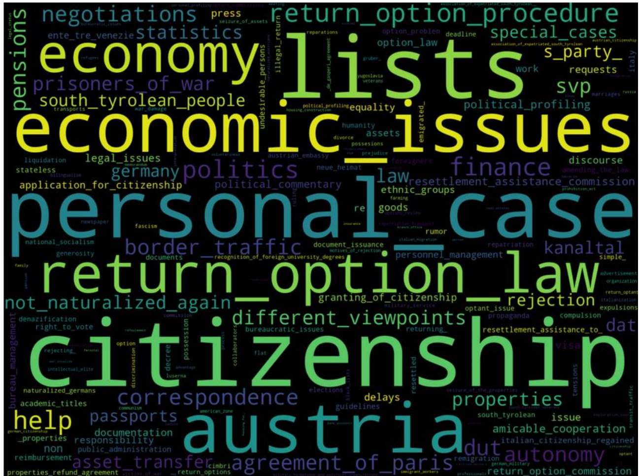
Abbildung 2: Wortwolke der vergebenen Keywords für die einzelnen Akten

Diskurses, gefolgt von Verhandlungen (negotiations) um das Rückoptionsgesetz (return option law) sowie das Prozedere rund um die Rückoption (return option procedure) zwischen Österreich (austria) und Italien. Die unterschiedlichen Standpunkte (different viewpoints) Österreichs und Italien zeigen sich auch in den Verhandlungen um die Renten (pensions), Besitztümer (properties) und anderen finanziellen Angelegenheiten (finance). Auch die Unterstützung der Rückoptant:innen bei der Rückkehr (help and settlement assistance) sowie das Schicksal der Kriegsgefangenen sind bedeutend im politischen Diskurs zur Rückoption.