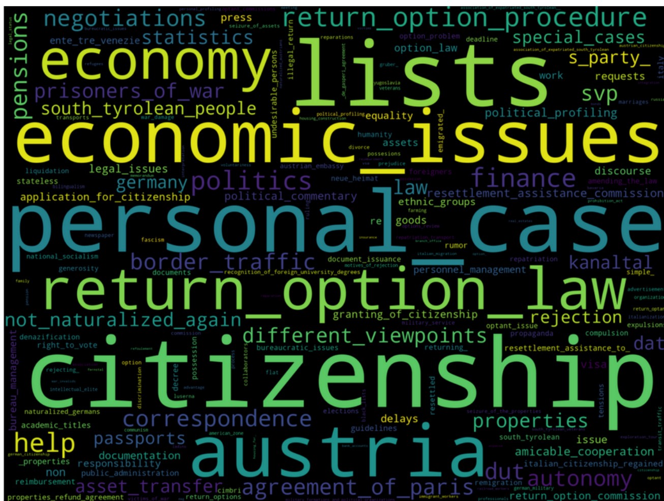
Figura 2: Cloud delle parole chiave per fascicolo