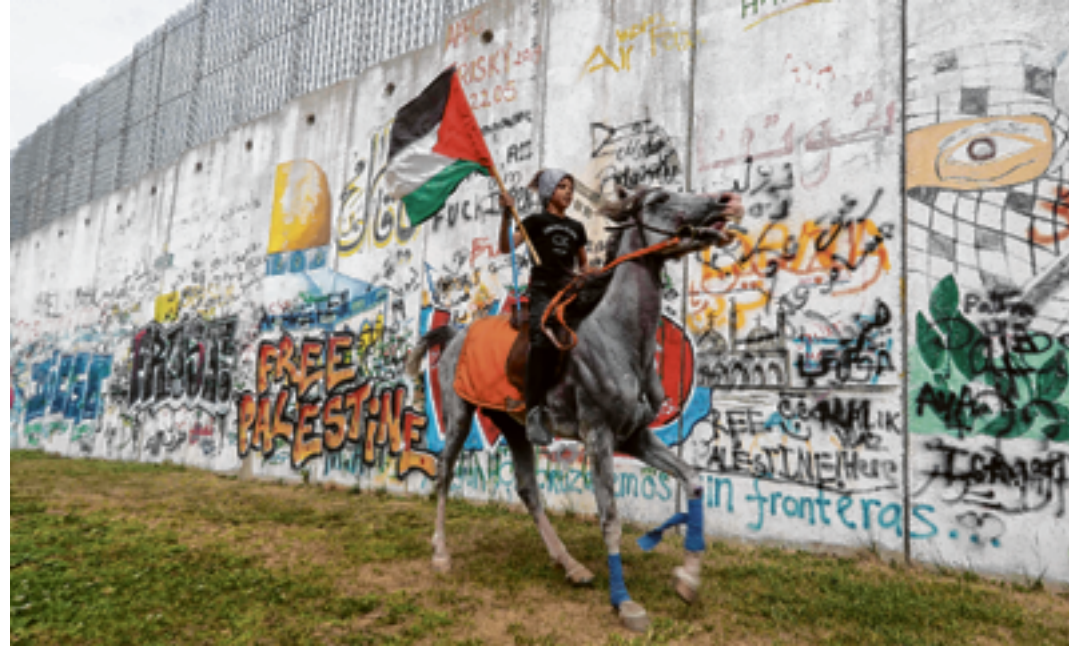
Realität 2003: Palästinensischer Bub mit Fahne an der Sperrmauer, die Israel und die größten Siedlungsblöcke von den Palästinensern abtrennt. Die Gewalt hat zuletzt wieder zugenommen.