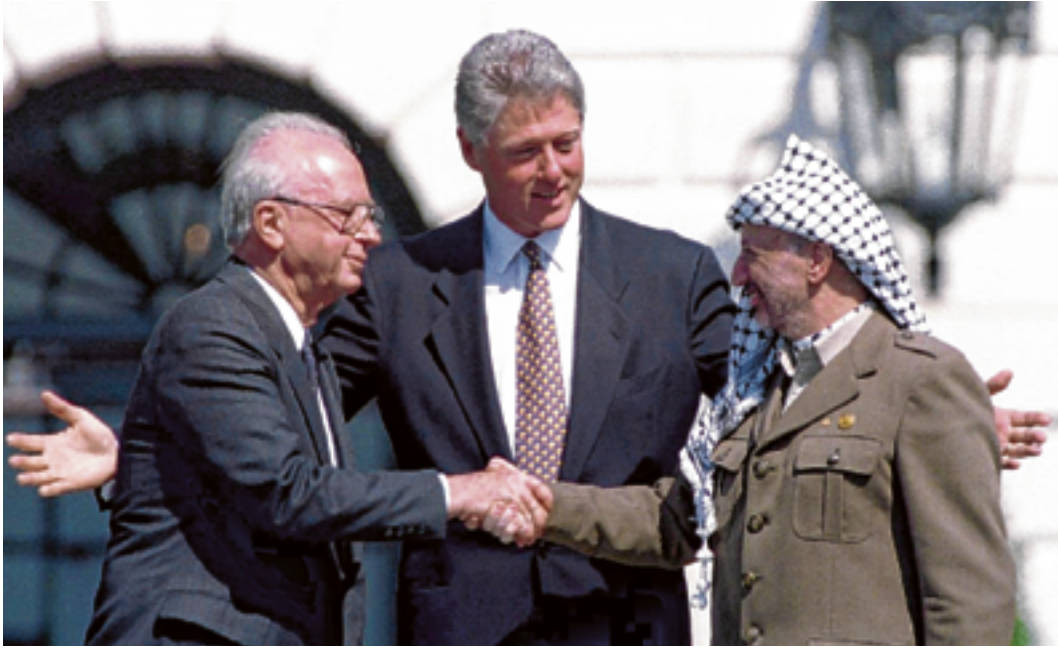
Hoffnung 1993: historischer Handschlag von Rabin (links) und Arafat, dahinter US-Präsident Bill Clinton. Im Jahr darauf folgte der Friedensnobelpreis. Doch das Abkommen wurde nie vollständig umgesetzt.