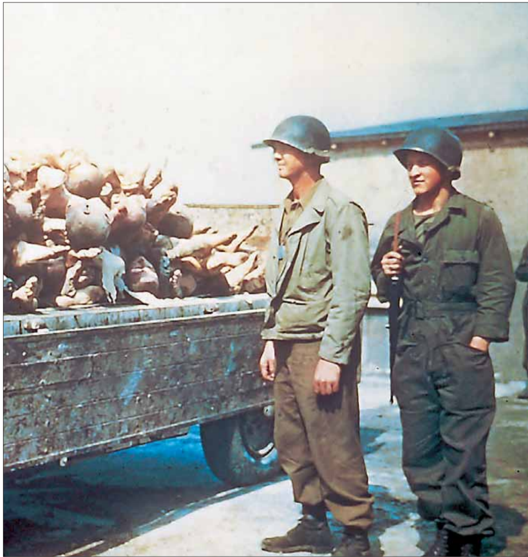
Im KZ Buchenwald wenige Tage nach der Befreiung am 11. April 1945.

Die Geschichte des Massenmordes an den Juden Europas begann mit dem Überfall auf die Sowjetunion. Am 31. Juli 1941 erhielt Heydrich von Hermann Göring den erwähnten Auftrag; das viel zitierte Schriftstück ist von Heydrich selbst entworfen worden, er hat es von Göring unterschreiben lassen. Es waren 4 Einsatzgruppen gebildet worden – SS, SD, Mitglied der Kriminalordnungs- und Feldpolizei, etwa zwischen 600 und 1000 Mann. Die entsprechenden Befehle Heydrichs lauteten: „Zu exekutieren sind alle Juden in Partei- und Staatsstellungen.“ Bis Ende 1941 hatten die Einsatzgruppen etwa 500.000 Menschen ermordet; im Dezember 1941 war etwa das SS-Spezialkommando im Reichsgau Wartheland in Kulmhof aktiv; Juden wurden in umgebauten Lastkraftwagen erstickt. In Serbien hatte es Massenerschießungen gegeben; das KZ-Auschwitz war im Juli 1940 eröffnet worden; dort hatte man im September 1941 mit der Erprobung des Gases Zyklon B begonnen; ab September 1941 mussten die Juden im Reichsgebiet den Judenstern tragen; am 14. Oktober 1941 gab es den ersten Deportationsbefehl. Ghettos galten als Wartestation auf den Tod. Am 24. Oktober 1941 gab es die zweite Deportation und Massenerschießungen in Kovno; am 30.