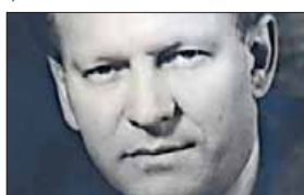
In seinem Antwortschreiben

„Entsprechend unserer mündlichen Verständigung erlaube ich mir zu bestätigen, dass die italienische Regierung bereit sein wird, alle Vorschläge der österreichischen Regierung genau zu prüfen („give careful attention“), die auf die beste Lösung der in Artikel 10 enthaltenen Punkte, so wie in dem von uns vereinbarten Text enthalten, abzielen.“