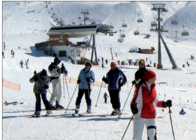
Organisierter Skiraum: Pistenbetreiber müssen atypische Gefahren absichern, wie Steilabhänge, ungesicherte Metallstangen, Liftstützen und Schneekanonen.

Bei Skirennen und beim Skitraining besteht zwischen dem Verein als Veranstalter und dem Läufer ein besonderes Schuld- und Verpflichtungsverhältnis, weil es sich dabei, anders als bei sonstigen alpinen Vereinen, um die Vereinsleistung im eigentlichen Sinn handelt. Der Verein haftet in diesem Fall auch