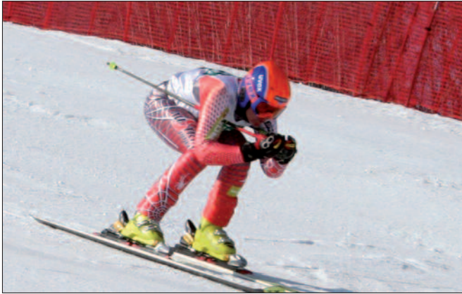
Skirennen: Den Veranstalter trifft die Verantwortung für die Sicherheit auf der Rennpiste.

tenbetreiber, andere Skifahrer) zurückzuführen. Handelt es sich bei dem Verunfallten um einen Arbeitnehmer, wird ihm von seinem Arbeitgeber für die Dauer der Arbeitsunfähigkeit Krankenentgelt bezahlt (§§ 2ff Entgeltfortzahlungsgesetz bei Arbeitern, § 8 AngG bei Angestellten).