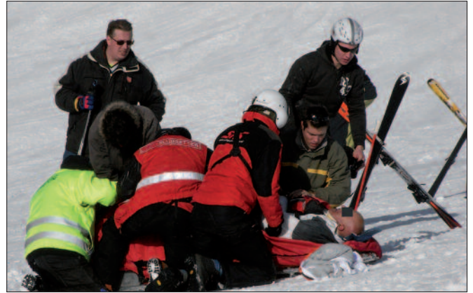
Skiunfall: Etwa zehn Prozent der Wintersportunfälle werden durch Dritte verschuldet.

Der Abschluss einer Haftpflicht- und allenfalls einer Unfallversicherung ist ratsam, weil nach § 131 Abs. 4 ASVG Bergungskosten und die Kosten der Beförderung ins Tal bei Unfällen in Aus-