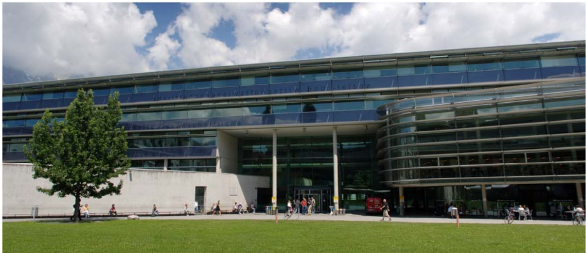
Innsbruck University School of Management

– Team Service Management und Tourismus –