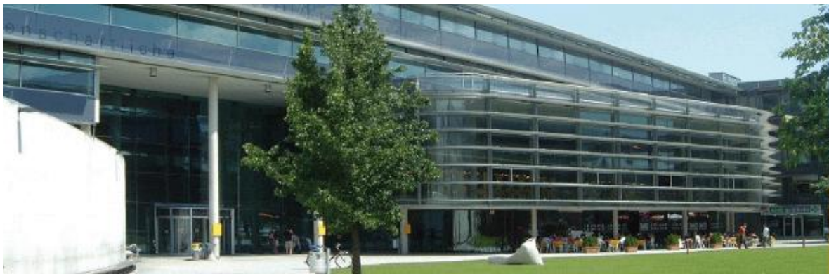
University of Innsbruck School of Management