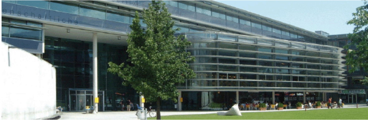
University of Innsbruck School of Management