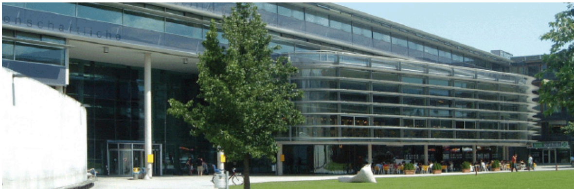
University of Innsbruck School of Management