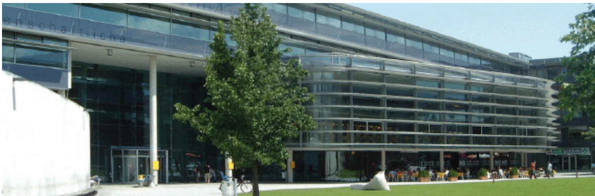
Universität Innsbruck Fakultät für Betriebswirtschaft