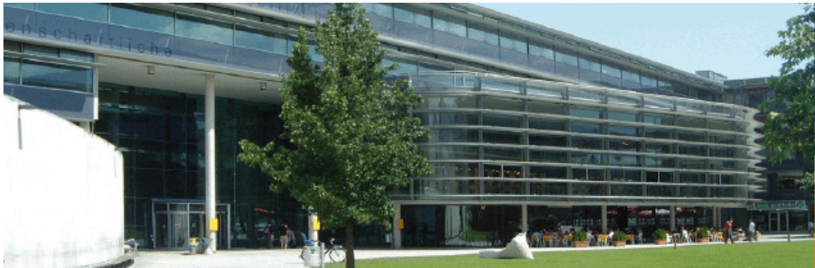
University of Innsbruck School of Management