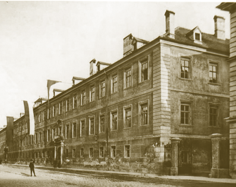
Die alte Universität in der Universitätsstraße um 1895.