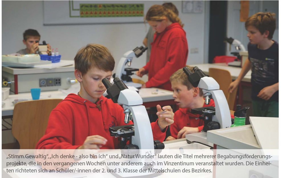
„Stimm.Gewaltig“, „Ich denke - also bin ich“ und „Natur.Wunder“ lauten die Titel mehrerer Begabungsförderungsprojekte, die in den vergangenen Wochen unter anderem auch im Vinzentinum veranstaltet wurden. Die Einheiten richteten sich an Schüler/-innen der 2. und 3. Klasse der Mittelschulen des Bezirkes.

Nüsse: herbstfrisch, schmackhaft – und gesund. Eine Schüssel voll mit diesen köstlichen Früchten steht einladend auf dem Tisch in meinem Zimmer. Nüsse verschiedener Art hat jeder zu knacken – ob Schüler oder erwachsener Begleiter. Einmal im Herbst knackt jede Oberschulklasse gemeinsam: bei den Einkehrtagen, meist in einem Selbstversorgerhaus, von Donnerstag bzw. Freitag bis Samstag, mit Begleitern, die die Energie der Klasse provozieren und in geordnete Bahnen lenken. Da geht es darum, Augen und Ohren zu öffnen für alles, was eine reine Zweck(klassen)gemeinschaft übersteigt. Da geht es darum, ohne den gewohnten Rhythmus von Schul- und Heimaltag alles „einmal anders“ gestalten und erleben zu können: Wie kriegt man wohl die Nudeln so hin, dass niemand verhungern muss? Wie verhindern wir, dass die Werwölfe das Spiel gewinnen? Wie gestalten wir die Dynamik eines freundschaftlichen Zusammenseins, das niemanden zum Außenseiter macht? Mit welchen Themen und Fragen, die uns schon lange reizen, testen wir die Knack-Geschicklichkeit unserer Begleiter? Gönnen wir uns den Luxus gemeinsamer stiller Momente, um besser hören zu lernen? Um ganz daheim zu sein bei mir selbst? Um Gottes faszinierende Gegenwart in all meinem Erleben zu entdecken? Aufbrechen ist nicht leicht. Aber spannend. Mir/uns bei Einkehrtagen eine Auszeit nehmen und harte Nüsse knacken. Meisterhaft, wenn ich bei mir selbst damit anfangen – und schmackhaft werde für andere.