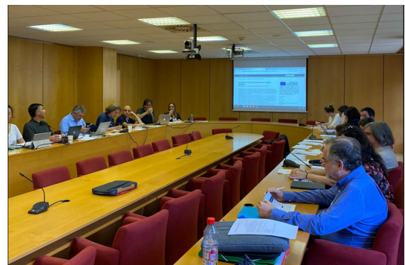
Informationsveranstaltung an der Universität von Valencia.

Eine Informationsveranstaltung an der Universität von Valencia, an der spanische Vertreter*innen der Zielgruppe der Evaluierenden teilnahmen, bildete den Höhepunkt des transnationalen Treffens. Nach einer Präsentation des Projekts fand ein intensiver Meinungsaustausch mit der Zielgruppe statt.