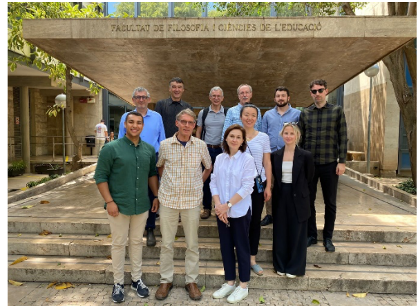
Das RecoVET-Projektteam in Valencia.

Kofinanziert durch das Programm Erasmus+ der Europäischen Union