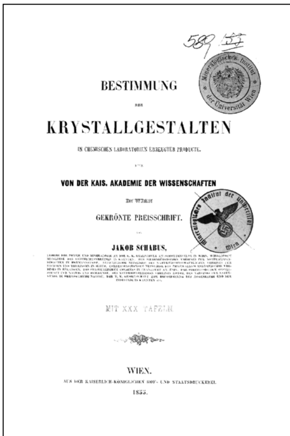
Abbildung 1: Titelseite der Preisschrift: Bestimmung der Kristallgestalten aus 1855 (208 Seiten, 30 Tafeln). Die zwei Stampiglien weisen auf den Besitz des Werkes in den Jahren von 1938 bis 1945 und ab 1945 durch das Mineralogische Institut der Universität hin.

Die ausgeführten Messungen wurden mit Hilfe eines Reflexgoniometers durchgeführt. Eine detaillierte Beschreibung dieses verwendeten Goniometers wurde von MITSCHERLICH (1843) gegeben. Die Bedeutung dieser Abhandlung (Titelseite in Abbildung 1) kann an Hand einer Aufstellung von Hand- und Lehrbüchern, wel-