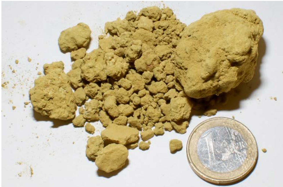
Abb. 2 Sediment aus der Humpleu Höhle.