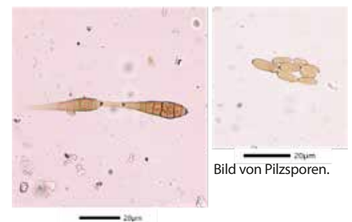
Bild von Pilzsporen.