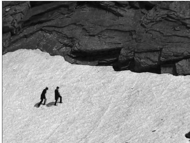
-Videoeinspielung 1, SW, ohne Ton, 2 Min, Filmechtzeit-

Enden tut das Ganze wie es begonnen hat, als eine Kunst nach der Natur, am Berg.