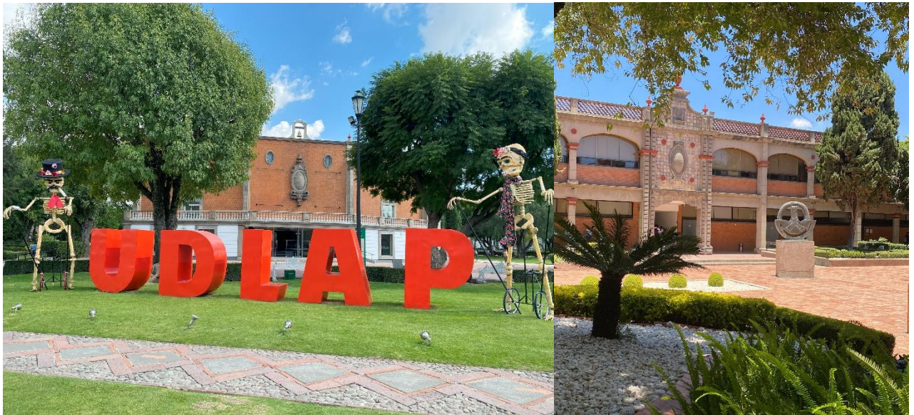
Campus der Universität

Während meines Aufenthalts in Mexiko bin ich auch sehr viel gereist und habe ganz viele großartige Orte kennengelernt. Ich habe beispielsweise den Unabhängigkeitstag in Guanajuato mit hunderten von Menschen gefeiert, bin in Tijuana über die Grenze nach USA gelaufen, habe in Puerto Escondido Biolumineszenz gesehen und habe in Oaxaca den Tag der Toten gefeiert. All diese Eindrücke und Erlebnisse sind einzigartig und ich werde sie nie wieder vergessen. Ich bin unglaublich dankbar, diese Chance gehabt zu haben und würde es jedem weiterempfehlen.