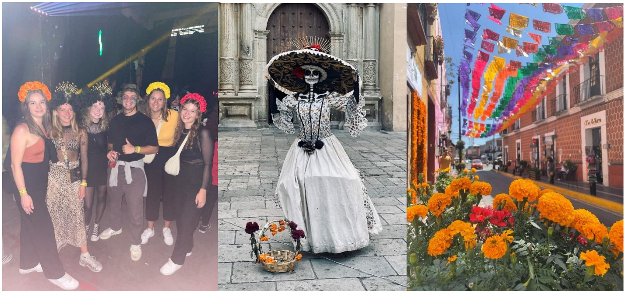
Día de muertos