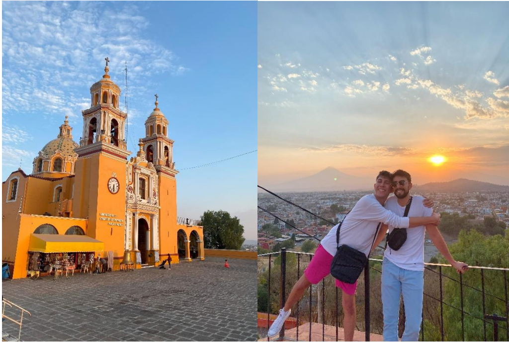
Kirche und Aussicht von der Pyramide