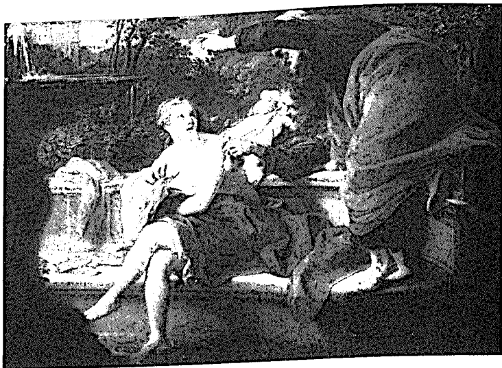
»Susanna und die beiden Alten« von Pompéo Batoni (1708–1787)

erklären, Susanna in ihrem Garten beim Ehebruch beobachtet zu haben, und sie erhalten ohne weiteres Recht. Susanna wird zum Tode verurteilt und fügt sich. Doch in letzter Sekunde wendet sich das Blatt: Auf dem Weg zum Richtplatz ergreift Daniel, ein junger Mann aus der Menge, das Wort. Er erklärt die Unschuld Susannas, und kündigt an, sogleich den Beweis anzutreten. Er verfügt, daß die beiden Zeugen getrennt werden und zu dem angeblichen Ehebruch einzeln aussagen. Und sie verstricken sich in Widersprüche: Bereits die einfache Frage, was es denn für ein Baum gewesen sei, unter dem Susanna mit ihrem angeblichen Liebhaber gelegen habe, zeigt keine Einigkeit unter den »Zeugen«. Damit ist Susanna gerettet, ihre Unschuld und ihre Keuschheit sind bewiesen. Nun trifft die beiden Alten die Höchststrafe, und das Stück endet mit einem Loblied auf die weibliche Tugend.