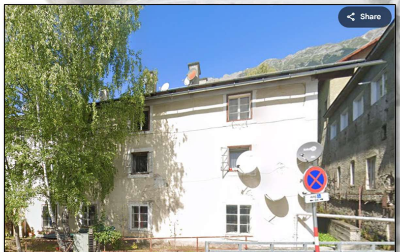
Ehemalige Gießerei in Mühlau, Innsbruck