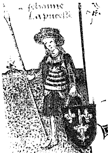
Die älteste Darstellung Johannas. Illustration aus „Le Champion des Dames“ von Martin le Franc, 1451. Bibliothèque Nationale, Paris

Es gibt zahllose Bilder und Statuen der Jeanne d'Arc, aber ein unbedingt glaubwürdiges Porträt ist nicht auf uns gekommen. Sie selbst hat auf die Frage im Prozess, ob je ein Bild von ihr gemacht worden sei, gesagt, sie kenne nur eines, auf dem sie kniend dem König einen Brief überreicht; sie habe es in Arras in der Hand eines Schotten gesehen und habe es ähnlich gefunden. Doch hat man dieses Bild bisher nicht entdeckt. So müssen wir uns an ihre Zeitgenossen halten, insbesondere an diejenigen, die sie gekannt haben. Aus den Schilderungen, die sie von ihrem Äußeren geben, wissen wir, dass sie ein kräftiges Mädchen war, gedrungen, aber gut gewachsen, mit bäuerlichem Gesicht, dunklem Haar und üppiger Brust – von der d'Aulon sagt, dass er sie bei manchen Gelegenheiten mit Vergnügen gesehen habe. Er nennt sie auch schön und groß, und