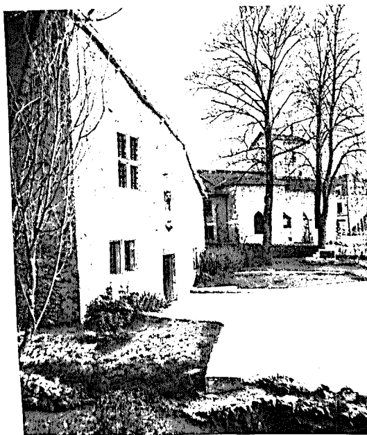
Das Elternhaus in Domremy

Jeanne d'Arc von Papst Benedikt XV. heilig gesprochen.