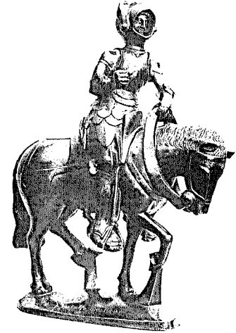
Johanna zu Pferde, Bronzestatuetten, 15. Jh. Musée Cluny Paris

war ihr zuwider. Sie lehnte es ab, als Wundertäterin zu gelten und wies die Frauen, die die Hufe ihres Pferdes berühren wollten, unwillig zurück. So kann sie auf die Ermahnung eines Geistlichen, vor Abgötterei auf der Hut zu sein, gelassen antworten: Wabrhaftig, ich wisse nicht, wie ich mich davor büten könnte, wenn Gott mich nicht bebüetete. War sie eine Heilige, eine Mystikerin? Beides trifft für sie nicht ganz zu. So sehr sie bestrebt war, Gottes Willen zu erfüllen, so tat sie es ja nicht in einsamer Meditation oder im Bemühen, den Forderungen der christlichen Lehre nachzukommen. Ihr ganzer Wille richtete sich auf die Erreichung eines militärischen und politischen Ziels. Eine Kriegsheilige, wie George Bernard Shaw, auf die in dem Wort liegende Paradoxie deutend, sie nennt. So wird man in ihr am ehesten eine Prophetin sehen können, die zur Märtyrerin wurde. Prophetin – das wirft nochmals die Frage nach ihren Stimmen und Visionen auf, in denen wir, es wurde schon gesagt, die Projektionen ihrer eigenen Wünsche und Ziele erkennen. Wie unbewusst ihr das war, zeigt ihre Reaktion und die Reinheit ihrer Seele, beim er-