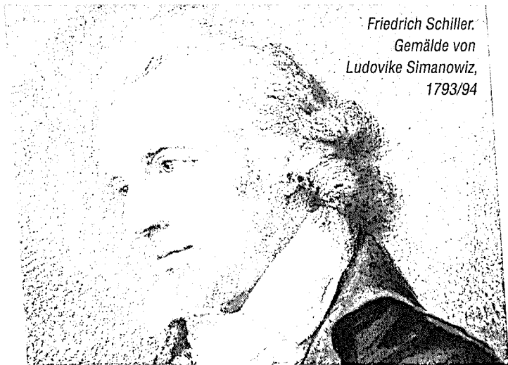
Friedrich Schiller. Gemälde von Ludovike Simanowiz, 1793/94