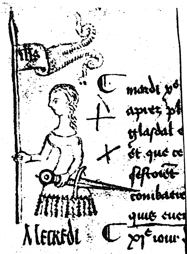
Die erste Zeichnung, die ein Schreiber von der Jungfrau anfertigte – Register des Pariser Parlaments (1428–36) mit Notizen über die Belagerung von Orléans