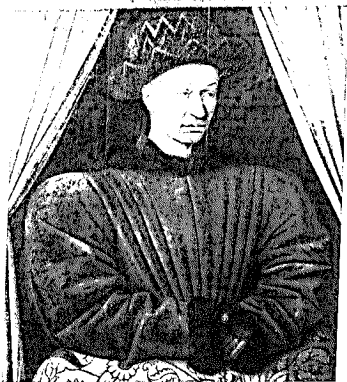
König Karl VII. Gemälde von Jean Fouquet. Louvre, Paris

Sieht so ein Sieger aus? Viele haben schon das um 1450 von Jean Fouquet gemalte Portrait Karls VII. (1403 – 1461) zu deuten gesucht, und meist entsprachen die Interpretationen nicht gerade der Bildlegende le tres victorieux : Schwach und entschlossenlos, verdrießlich und müde schauende dieser König aus; und