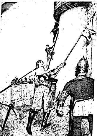
Jeanne d'Arc erringt den Sieg von Orléans. Musée Jeanne d'Arc du Vieux Marché Rouen

...ras ein französisch-burgundischer Separatfrieden geschlossen wurde. Doch sollte man darüber nicht vergessen, dass erst durch Johannas Bellizismus Frankreich kriegsstärker und Burgund seinerseits friedensbereiter gemacht worden ist, dass sich erst seit der durch sie herbeigeführten Wende von Orléans die Tendenzen und strukturelle Faktoren wieder wirkmächtig entfalten konnten.