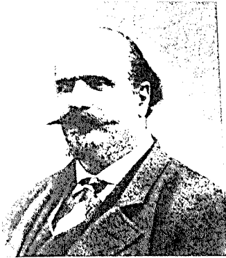
Temistocle Solera. Photographie. Conservatorio „G.Verdi“, Mailand

Dämonen erlangten große Popularität, sie wurden sogleich in das Repertoire der Mailänder Straßenorgeln und Bandas aufgenommen. Noch im selben Jahr folgten Aufführungen in Florenz, Rom, Venedig und Turin.