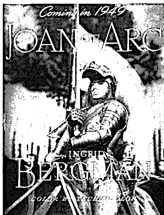
Ingrid Bergman in dem Film „Joan of Arc“, 1949

Zweifellos kannte der Geschichtsforscher Schiller die wahre, doch schon zu seiner Zeit recht ausführlich überlieferte Geschichte der Jeanne d'Arc. Doch diese interessierte ihn nur bedingt, hier noch weniger als in seinen anderen so neugierigen und, historisch gesehen, doch ungenauen Geschichtsdramen. Denn die Geschichte war ihm „überhaupt nur ein Magazin für meine Phan-