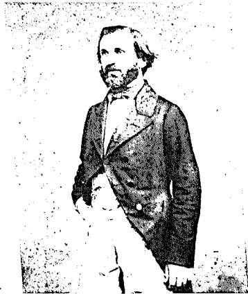
Verdi um 1844. Photographie. Museo teatrale alla Scala, Mailand

Regenbogen gleich verlief das Leben Johannas. Sie kam aus dem Nichts, erglühete in den schönsten Farben und ging genauso unscheinbar wieder in der Natur auf.