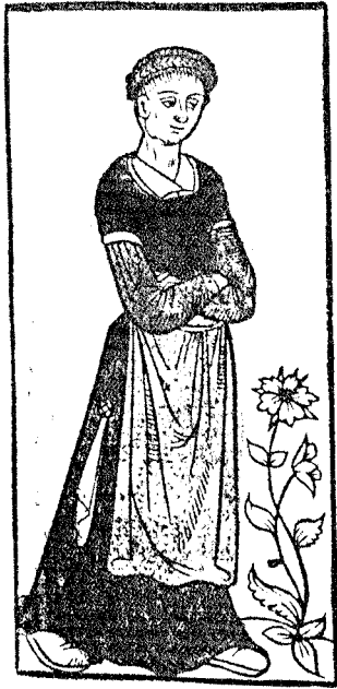
Johanna. Kolorierter Holzschnitt, 16 Jh. Bibliothèque Nationale, Paris

sen sie noch nicht erkennen. Erinnern wir uns: Die kleine Jeannette, fromm, fleißig, sanftmütig, ihren Stimmen hingegeben, wird in unwahrscheinlich kurzer Zeit zur Kriegerin, deren Energie, physischer Mut, ungestümer Tatendrang