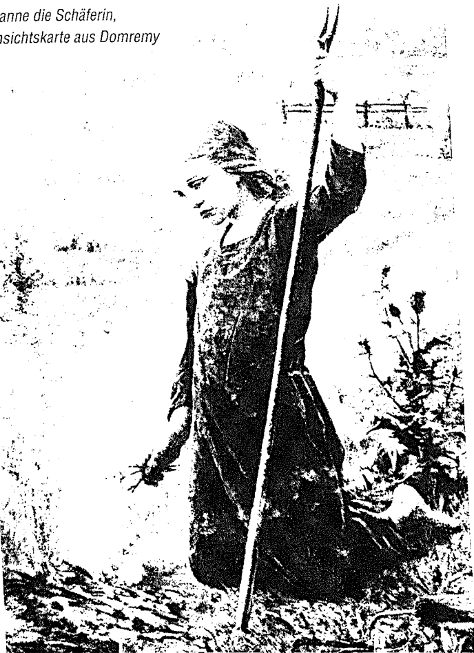
Jeanne die Schäferin, Ansichtskarte aus Domremy