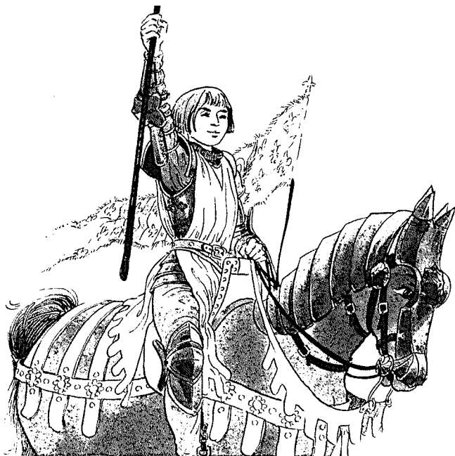
Comic aus dem „Jeanne-d'Arc-Shop“ in Rouen

von Schillers „sanft-gewaltigem Willen etwas in uns eingehe: von seinem Willen zum Schönen, Wahren und Guten, zur Gesittung, zur inneren Freiheit, zur Kunst, zur Liebe, zum Frieden, zu rettender Ehrfurcht des Menschen vor sich selbst“, mag so besonders wirkungsvoll eingelöst werden.