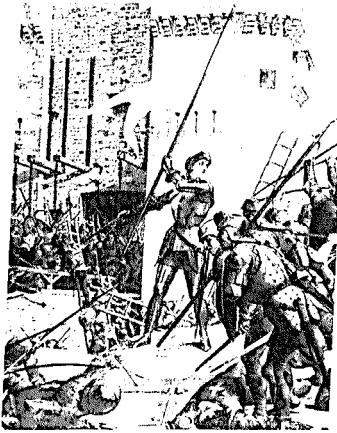
Johanna bei der Befreiung von Orléans. Gemälde, 19. Jahrhundert

nen Krieg gegen die Engländer durch die Entsetzung von Orléans und die Krönung Karls in Reims zu wenden vermochte, aber 1431 in Rouen als Ketzerin verbrannt wurde, dann 1456 rehabilitiert und 1920 heiliggesprochen wurde, jenseits des Rheins nie ankam. Das mag schon daran liegen, dass der Stoff in Frankreich schon zu Schillers Zeit längst durch war; als Vorwurf für Ballette, Opern, Melodramen und Ausstattungstücke aller Art. Von Voltaire wurde er geradezu verhöhnepiepelt – und in der