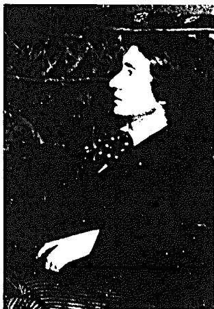
Der 19jährige Ermanno Wolf-Ferrari