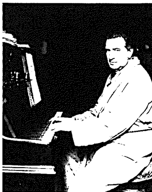
Der Komponist im Alter von 61 Jahren, ein Jahr nach der Uraufführung „Il Campiello“