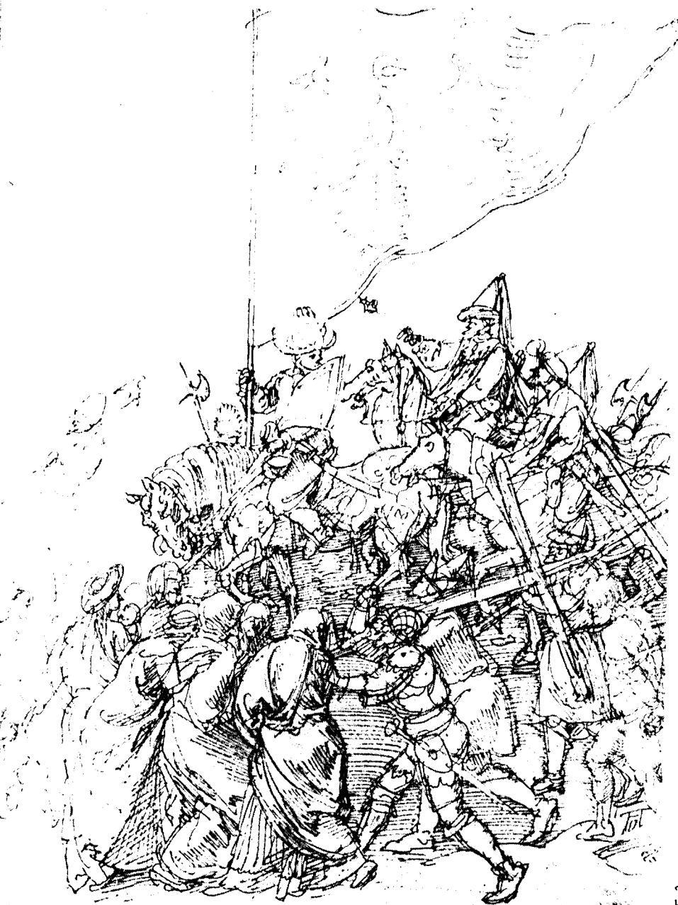
«Groep uit de kruisdraging van Christus» - Dürer.