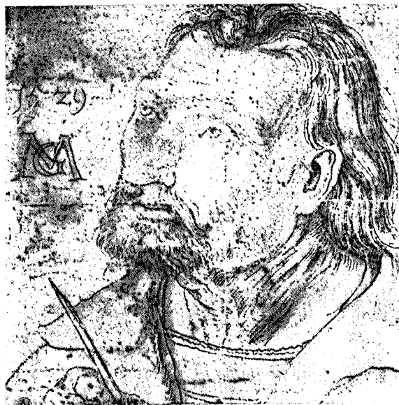
Mathis Gothart Nithart - Zelfportret

Grünewald bezat een zeer persoonlijke stijl die weinig invloed vertoont van zijn leermeesters of van zijn tijdgenoten. Hij wordt beschouwd als één van de grootste Duitse schilders van de vroege 16de eeuw, die nog geheel tot de laat-gotische schildertraditie kan gerekend worden. Zijn kleur- en lichtbehandeling doet zeer modern aan en bereikt als expressiemiddel de allerhoogste intensiteit. Nadat zijn werk na zijn dood in vergetelheid was geraakt, werd het opnieuw hoog gewaardeerd tijdens de barokperiode. Nog later brachten ook de expressionisten vóór en na de eerste wereldoor-