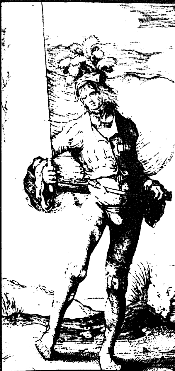
«Vaandeldrager» - Lucas van Leyden - 1510