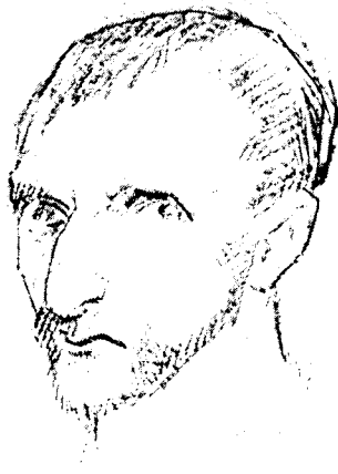
Vincent Van Gogh - zelfportret - 1887

En zo is er voor de derde keer sprake van geschiedenis. Niet van de geschiedenis van het werk, niet van de geschiedenis van diegene die het werk creëerde, maar van de geschiedenis die het werk zelf is. Wat dat betreft, draagt Paul Hindemith de volledige verantwoordelijkheid, en komt hem alle eer toe, niet alleen als componist, maar ook als de schrijver van het libretto. We mogen het gerust een literair werk noemen. Toen enkele kennissen het gedrukte tekstboek - vóór de voltooiing van de pianopartituur - in handen kregen (de uitgeverij mocht het destijds niet publiceren!), waren er meteen theaterdirecteurs en regisseurs die het werk ook zonder muziek graag opgevoerd hadden.