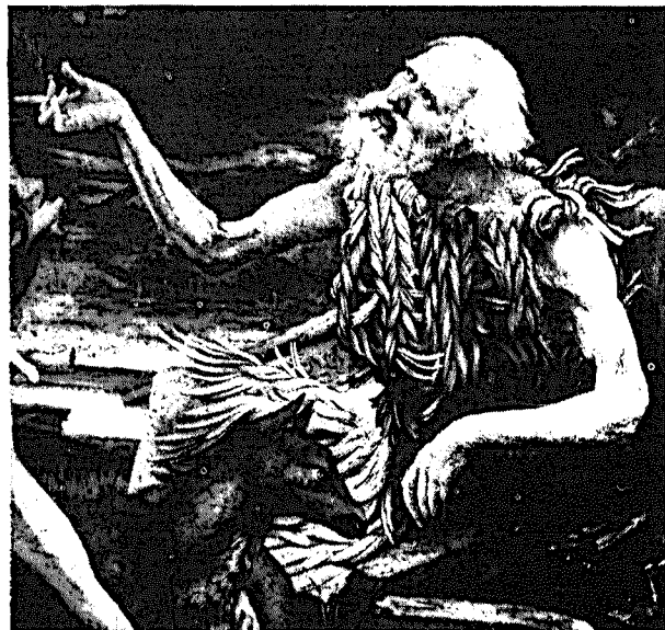
Mathis Grünewald als St. Plus - detail Isenheimer altaarstuk - 1512

Paul Hindemith zelf is door dit werk en door zijn artistieke zending in een eigenaardige historische positie terechtgekomen waar hij zelf niet om gevraagd heeft. Hij raakte in deze positie verzeild toen de drie afzonderlijke stukken van de opera in 1934 op voorhand verschenen; als «Mathis-symfonie» vormden ze een nieuw begrip in de moderne muziek. Tot dan toe had men de componist van «Sancta Susanna», «Cardillac», en «Neues vom Tage» van alle mogelijke kanten gedoodverfd als een afschuwelijke moderne muzikmaker; maar in het aanschijn van dit heerlijk muzikaal gedicht, dat met drie panelen van het Isenheimer altaarschilderij de romantische traditie van een groots verleden opnieuw tot leven roept, veranderen zelfs zijn hevigste tegenstanders van mening. Toen de componist in de ban geslagen dreigde te worden, brak er een complete opstand uit, waardoor men kon afdwingen dat Hindemith - tegen de zin van de regering in - toch nog enkele jaren geduld werd als een soort Duitse muziekgezag in Turkije, vooraleer hij «buitengewipt» werd, niet omwille van zijn muziek maar omdat hij met «niet-Ariërs» omging. De «Mathis-symfonie» heeft destijds als een vuursignaal