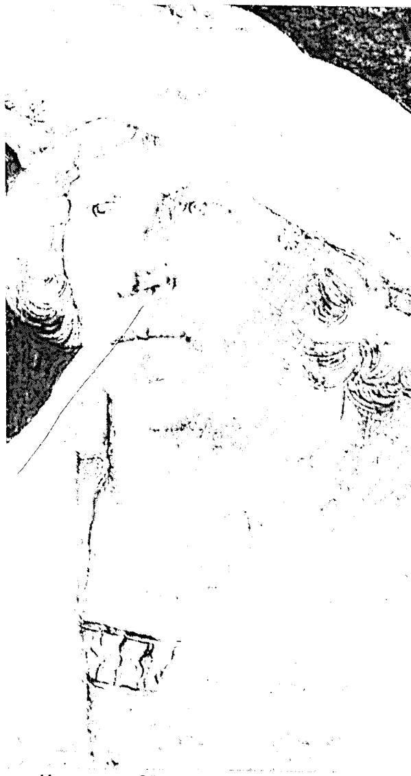
«Mansportret» - Dürer