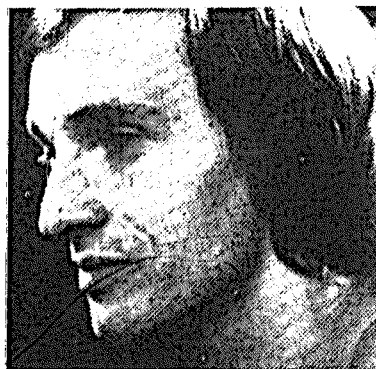
Aimé de Lignière