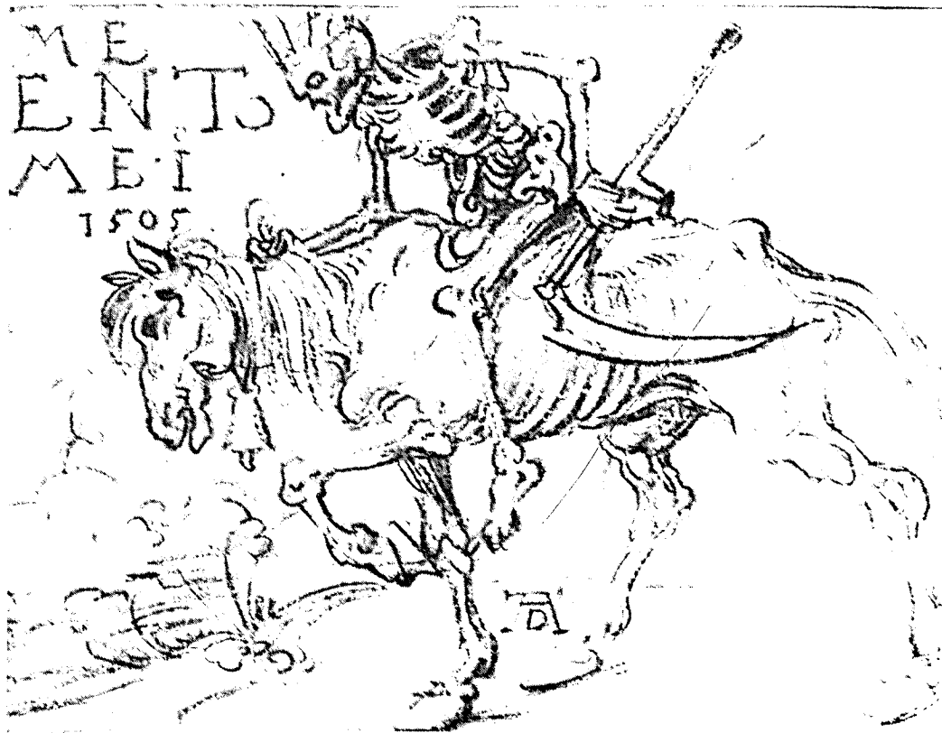
«Memento Mei» - Dürer - 1505

Helder van geest heeft hij de zorgen om zijn zoon en diens vermogen in Frankfurt overgelaten aan de drie aanwezige getuigen. Na het overlijdensbericht ontvangen te hebben, laat het raadscollege van Frankfurt een inventaris opmaken. Met ontsteltenis lezen we de uitvoerige opsomming