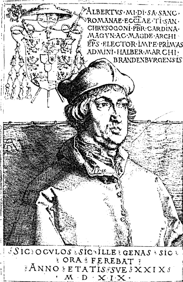
«Albrecht, Aartsbisschop van Maagdenburg» - Dürer - 1519.