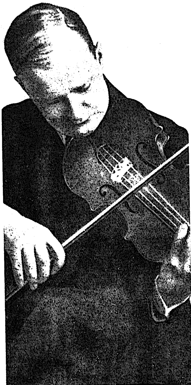
Paul Hindemith (omstreeks 1932)

dachten al bij de opera over Kepler «Die Harmonie der Welt», die uiteindelijk in 1957 zou worden gecreëerd.