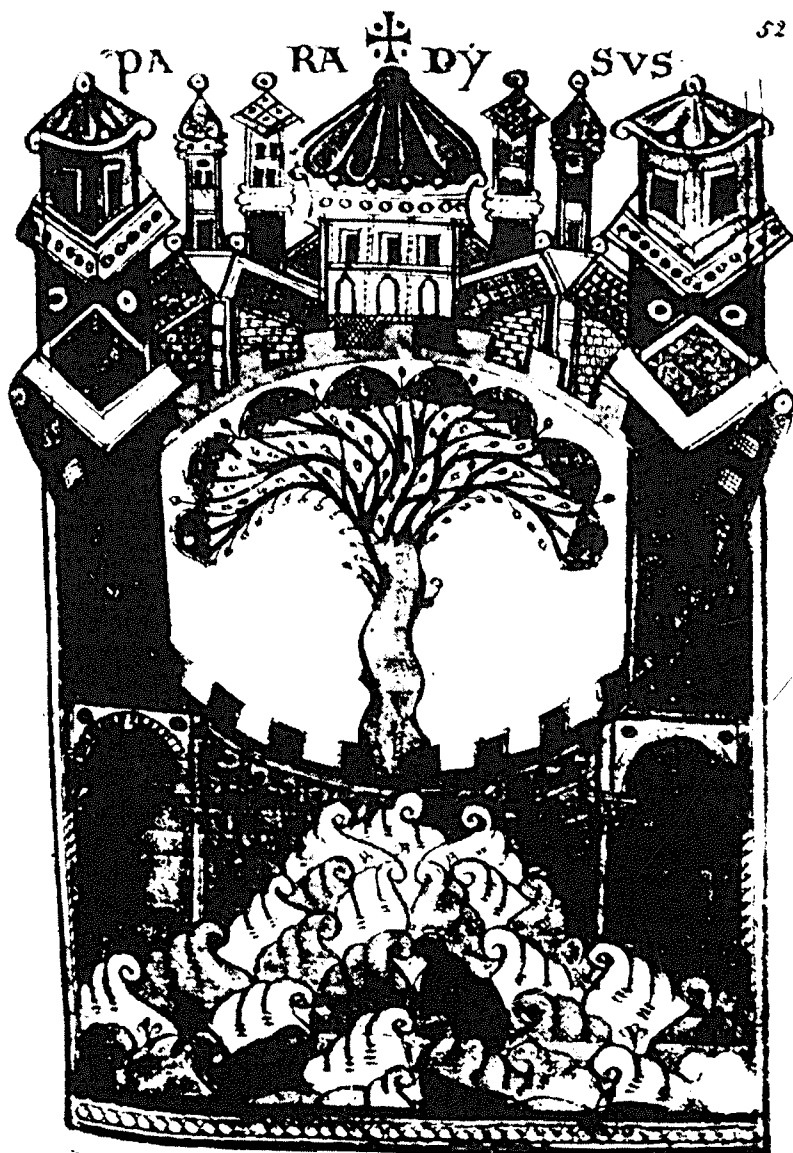
»Mit Türmen und Toren versehen« Paradies als Stadt, in der Mitte der Lebensbaum. Miniatur aus dem Liber Floridus 1120, in der St. Bavo Kathedrale zu Gent