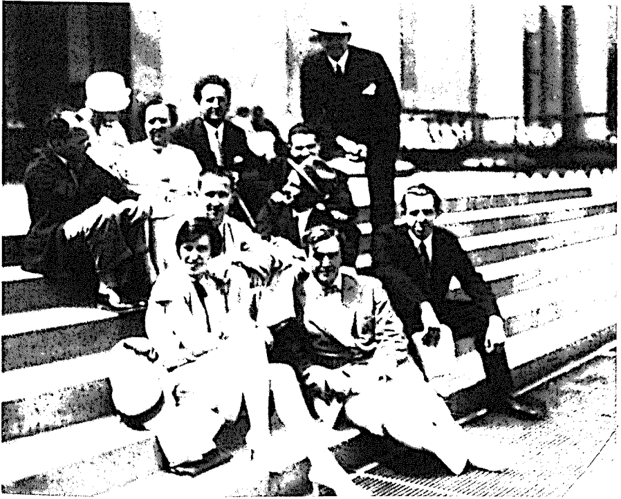
Auf dem Kammermusikfestival Baden-Baden 1927.