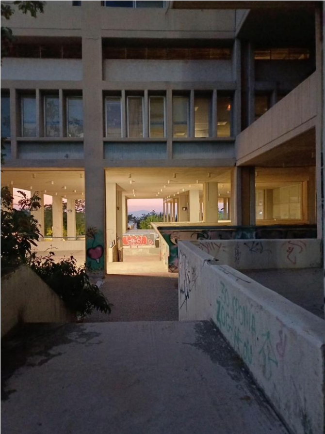
Das Archäologiemuseum der Universität: