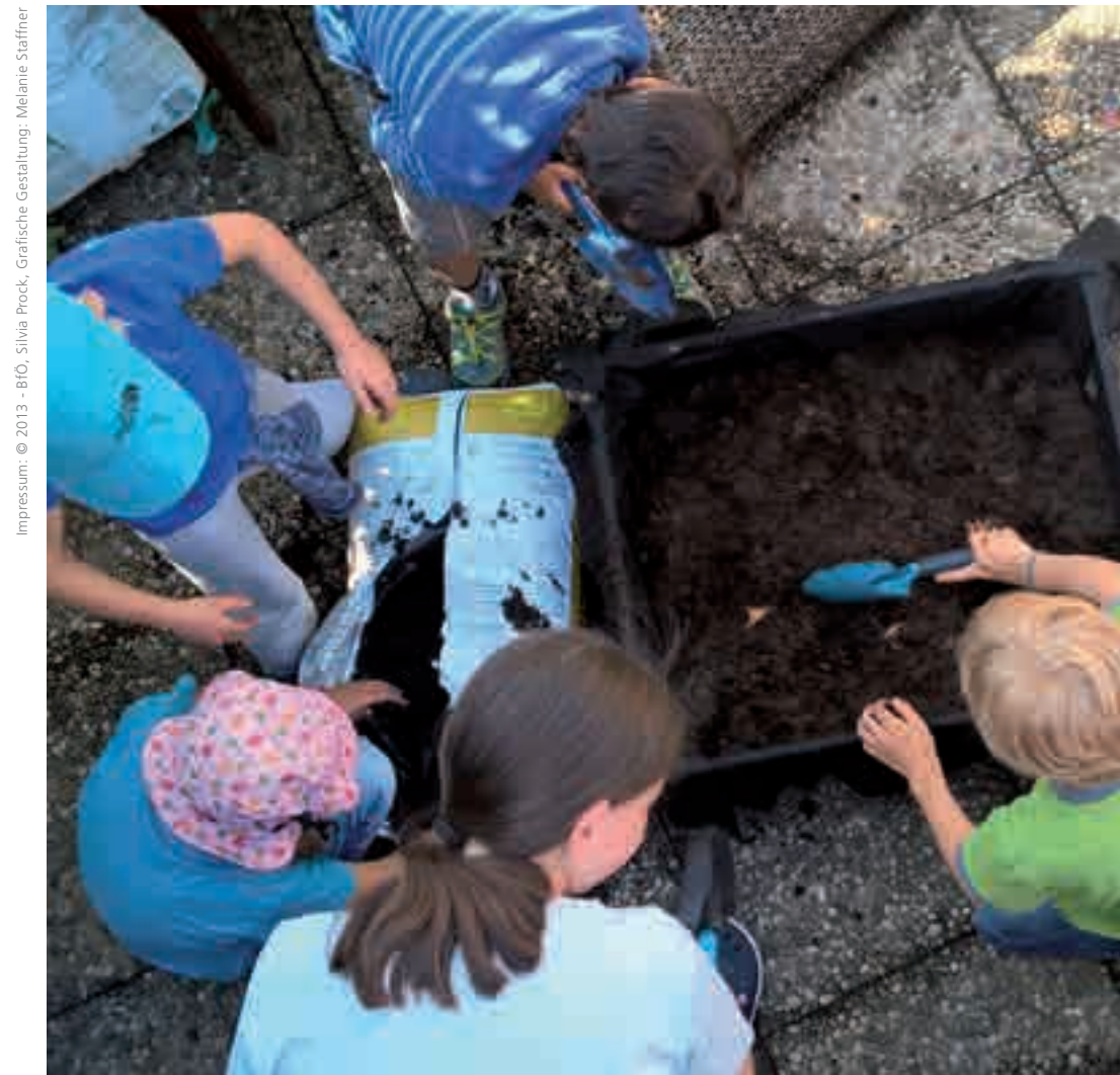
Impressum: © 2013 - BIO, Silvia Prock, Grafische Gestaltung: Melanie Staffner