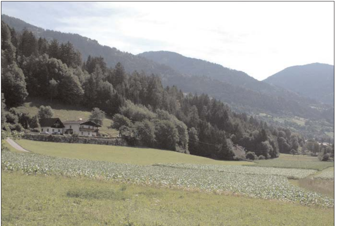
"Gline": Hier werden im Herbst Grabungen beginnen.

Die Grundmauern dieser Villenanlage wurden in den Jahren 1746 und 1753 bereits einmal freigelegt und mit damaligen Mitteln wissenschaftlich erforscht. Nach dem Ende der