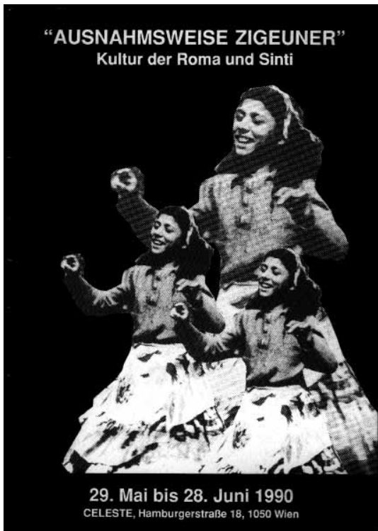
Plakat zur ersten Roma-Kulturpräsentation in Wien 1990

Wenn man sich heute die damals verwendeten Plakate anschaut, kann man allerdings nicht anders als kritisch dazu stehen, besonders das erste ist von Klischees geprägt.