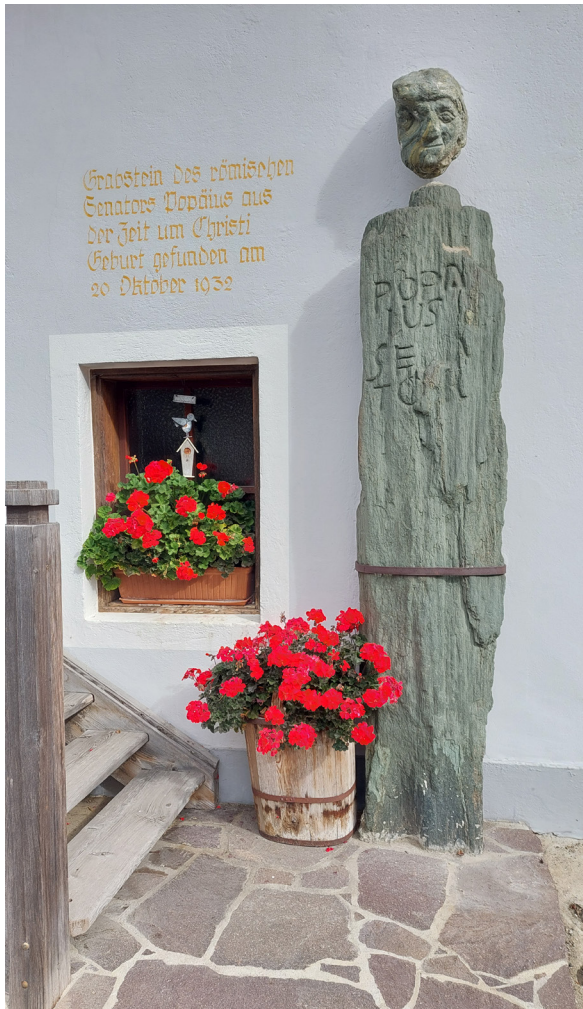
Abb. 4. Heutige Aufstellung des Steines des „Popäius Senator“ mit Kopf in Bichl, Matriei i. O.

Am 20. Oktober 1932 war der Stein gefunden worden und 14 Tage später war der Finder bereits im Besitz einer offiziellen Grabungsgenehmigung und hätte nun weitere Nachgrabungen vornehmen können. Solche wurden aber nicht durchgeführt und über die Gründe dafür kann nur gemutmaßt werden.