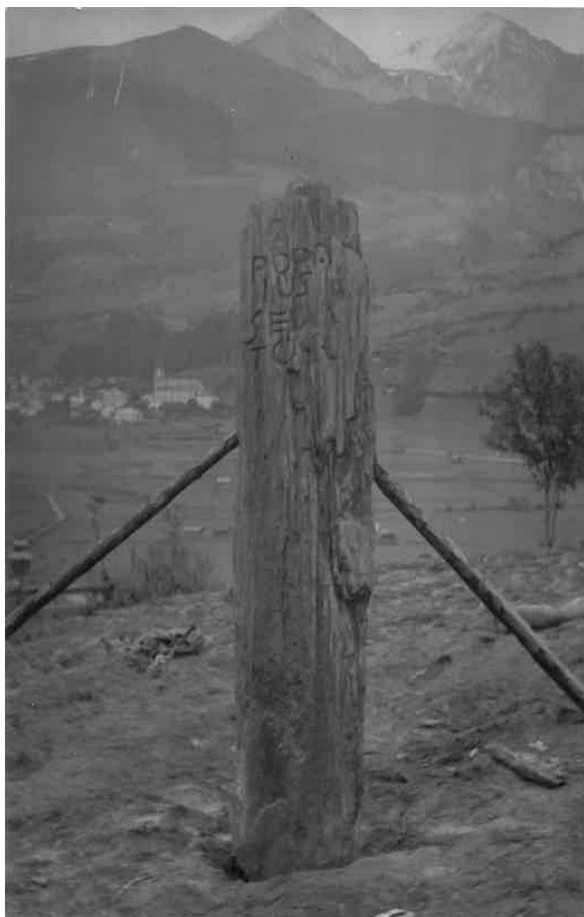
Abb. 2: Provisorisch aufgestellter Stein, Oktober 1932.

Das zweite stammte von der lokalen Heimatforscherin Rosa Ghedina-Pernter (1871–1952) 7 : „Gestern, am 20. d. M. hat man beim Umpflügen einer Wiese beim „Hanser“ in Bichl, Matrei-Land, einen Stein von 3 m Länge mit folgender römischer Inschrift bloßgelegt: POPA / IUS / SE _ _ _ / TOR [...] Es ist fast bestimmt anzunehmen, daß es der Grabstein des römischen Senators Popäjus ist und nicht ausgeschlossen, daß an jener Stelle ein römisches Gräberfeld aufzudecken wäre, da nach Bericht noch andere Steine ausgegraben wurden. Ich ersuchte den Besitzer, alles im gleichen Zustande zu belassen, aber die Leute sind sehr neugierig und wollen nachgraben. Höchste Eile tut not, um unsinnigen Verrichtungen vorzubeugen. Dies Euer Hochwürden zur Mitteilung, um rasch einschreiten zu können“ (Abb. 1) 8 .