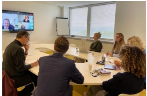
Der niederländische Runde Tisch, Utrecht, 23. Oktober 2023.

Die italienischen Partner legten besonderen Wert auf das Erfordernis, Fachkräfte adäquat mit Informationen und Instrumenten auszustatten , die eine korrekte Anwendung des RB unterstützen und damit zu einer Erleichterung ihrer täglichen Arbeit im Zusammenhang mit den Überstellungsverfahren beitragen können. Auch hier wurde die Bedeutung der Kommunikation zwischen Fachleuten und Mitgliedstaaten in Hinblick auf eine effiziente Anwendung des Rechtsinstruments betont.