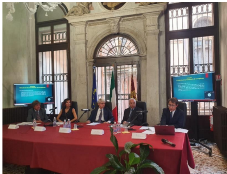
Der italienische Runde Tisch, Venedig, 29.09.2023.

Insgesamt nahmen 75 Praktiker:innen an den Veranstaltungen in Belgien, Frankreich, Italien, den Niederlanden, Österreich, Portugal und Rumänien teil.