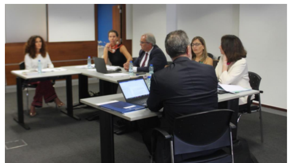
Der portugiesische Runde Tisch, Lissabon, 10. Oktober 2023.