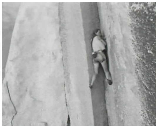
– Video 4: Houdini, verlangsamt –

Kehren wir mit diesem Wissen zum Anfang zurück, dorthin, wo Lynn Hill herunter, auf sicherem Boden mit ihren Armen dank ihrer Vorstellung aus dem Gedächtnis heraus einen Bewegungsablauf beschreibt, der wenig später, oben in ausgesetzter Position tatsächlich und mit Erfolg vollzogen werden konnte.