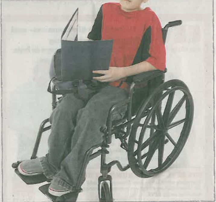
Beim Land sieht man keine Probleme für den Transport von Schülern mit Behinderung. Eine Aussprache mit dem Anbieter soll nun Klarheit bringen.