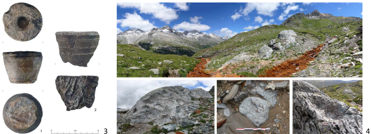
Abb. 3: 1 Lavezkern aufgelesen direkt im Bereich des Pfitscherjochs; 2 zwei zueinanderpassende Lavezgefäßfragmente aus frühmittelalterlichem Brandhorizont bei Abri 2 im Bereich der Lavitzalmhütte.