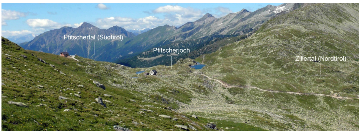
Abb. 1: Das 2.246 m hoch gelegene Pfitscherjoch verbindet das Nordtiroler Zillertal mit dem Südtiroler Pfitschertal.

Das Pfitscherjoch, ein breiter und mit 2.246 m relativ nieder gelegener inneralpiner Übergang, verbindet das Nordtiroler Zillertal mit dem Südtiroler Pfitschertal und fungiert somit als Bindeglied der beiden Regionen. Der Bereich nordöstlich des Joches gehört politisch zur Gemeinde Finkenberg in Nordtirol, der südwestlich zur Gemeinde Pfitsch in Südtirol. Das Gelände befindet sich oberhalb der Baumgrenze und ist durch ausgedehnte Weideflächen, mehrere kleine Gebirgsseen sowie unzählige Gesteinsbrocken gekennzeichnet (Abb. 1).