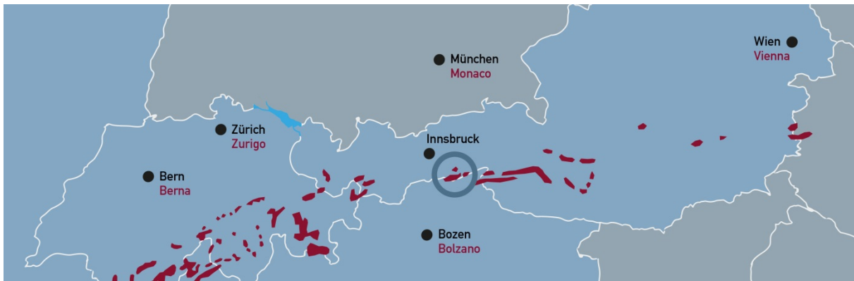
Abb. 2: Kartenausschnitt der Lavezlagerstätten in den Alpen. Blauer Kreis: Untersuchungsgebiet Pfitscherjoch, Talggenköpfe, Greiner. Nach Bachnetzer, 2015.

Nachdem die beim Abri 2 freigelegten Lavezgefäßfragmente einen ersten archäologischen Berührungspunkt mit diesem Gestein im Umfeld des Pfitscherjochs lieferten, gelangte ein am Pfitscherjoch auf Nordtiroler Seite aufgelesener Lavezkern, das Abfallprodukt aus der Produktion von Lavezgefäßen, an das Institut für Archäologien (Abb. 3).