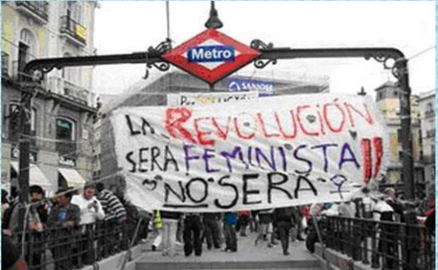
Madrid, Sol, M-15 (May, 2011) EGR / University of Manchester