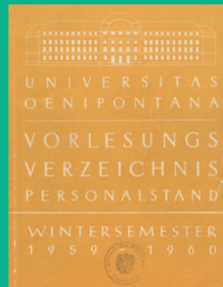
Deckblatt des Verzeichnisses Wintersemester 1959/60