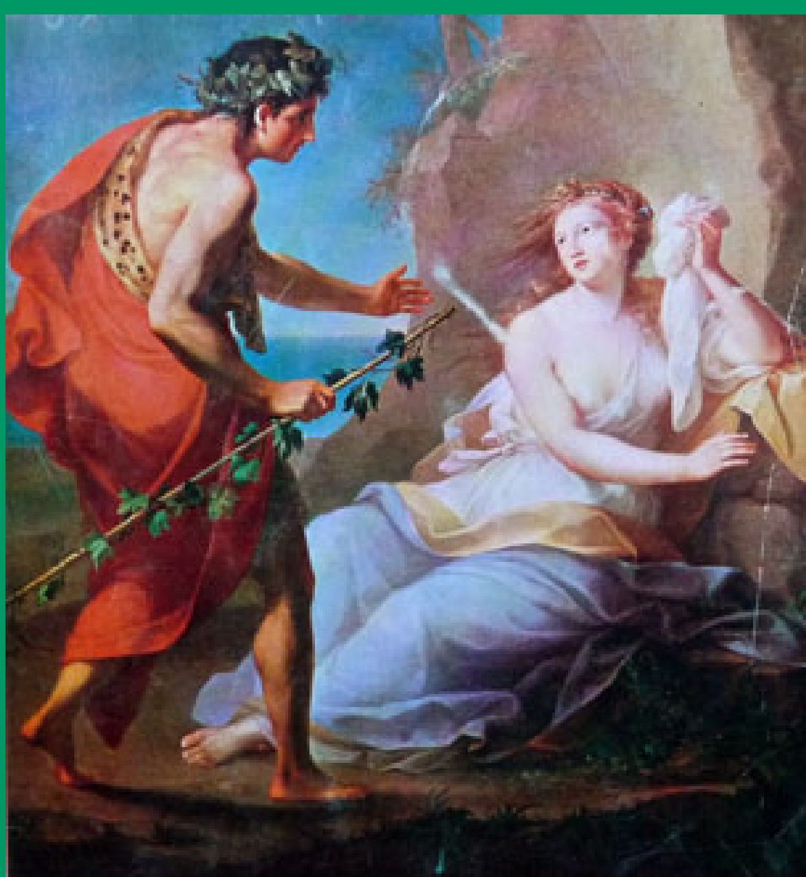
Angelika Kauffmann und ihre Zeitgenossen