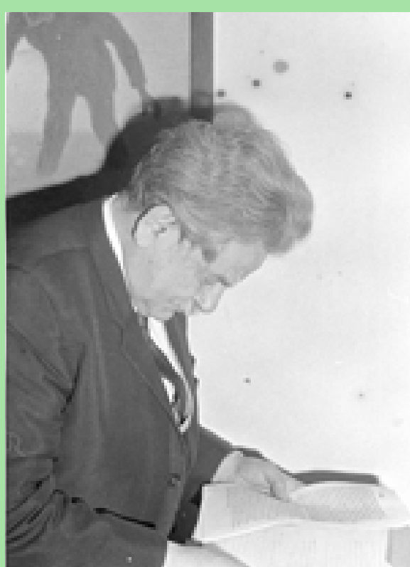
Elias Canetti, 1971