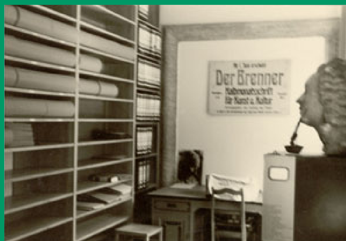
Die alten Räumlichkeiten des Archivs im Keller des Universitätshauptgebäudes