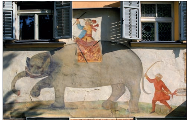
Fresko am Hotel «Elephant» in Brixen / Südtirol

Anfangen hat alles am Fuss des Brennerpasses in Brixen, wo ich die unerwartete Begegnung mit einem Bild machte, welches mich nicht mehr losliess: ein mächtiger indischer Elefant auf einem Fresko an einer Hotelfassade. Vor Jahrhunderten durchlebte er hier eine Erschöpfungsrast. Welche Geschichten wüsste er zu erzählen?