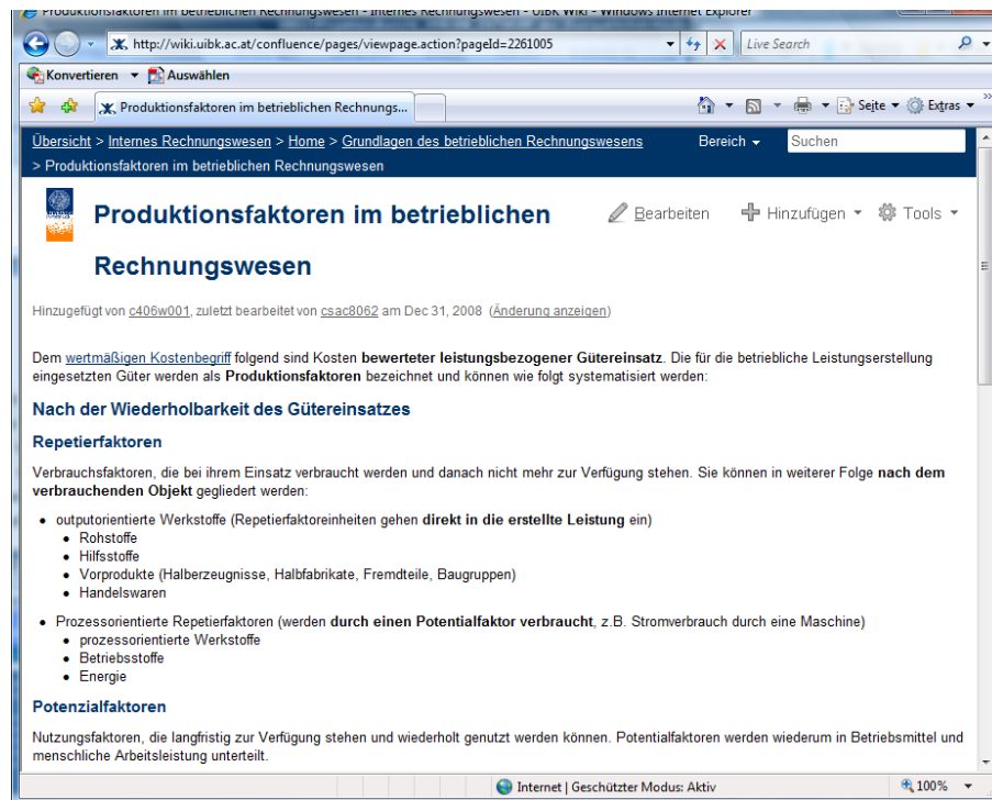
Abb. 2: Beispiel einer überarbeiteten Wiki-Bereichsseite

„Aufzählungslisten“ und „Rechenbeispiele in tabellarischer Form“ kommt es im Wiki nach wie vor zu Behinderungen.