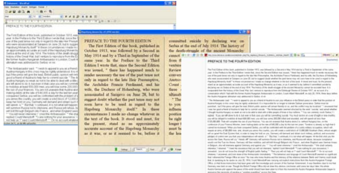
Steed, H. W. (1913). The Hapsburg monarchy. London, Constable.