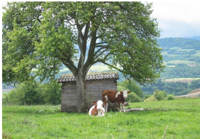
Idilična podoba Alp, ki še vztraja,....

Ne, sploh ne. DIAMONTova skupina se je odločila, da se v naslednjih delovnih stopnjah osredotoči na problem »Urbana središča in obrobja med konkurenčnostjo in sodelovanjem«. Tako si bomo z analizo močno pomagali, npr. za definicijo pomembnih pokazateljev za spremljanje procesov ali za iskanje inštrumentov regionalnega planiranja, ki bi lahko zmanjšali razlike. Še več, organi Alpske konvencije in uradniki iz programa Interreg IIIB Območje Alp so nas povabili, da naše rezultate objavimo in razširimo ter o njih razpravljamo ob različnih priložnostih, kakršna bo npr. Glavna prireditev Območje Alp junija 2006 v Stresi v Italiji.