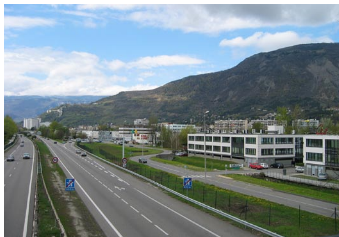
... a se spopada z manj romantično realnostjo.