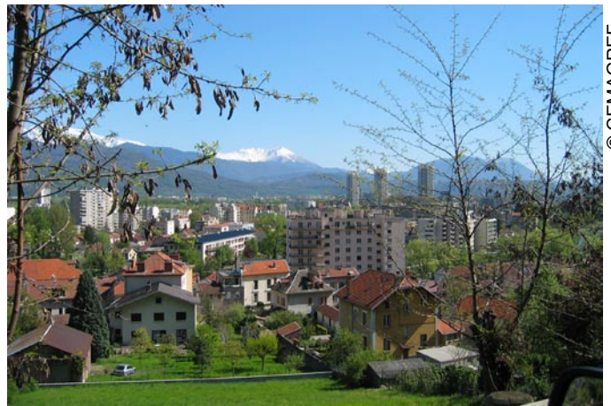
Urbanizirana pokrajina – običajna v Alpah.

Na splošno se vse Alpe ukvarjajo s podobnimi problemi. Najboljši primer so klimatske spremembe, ki vplivajo