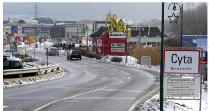
Industrijsko območje v dolini Inna, Avstrija: vedenje potrošnikov velja za glavno gonilno silo regionalnega razvoja.

tike v Alpskih državah. Primerjalna analiza za celotno območje Alp skuša prikazati »pokrajino«, ki je rezultat take regionalne politike.