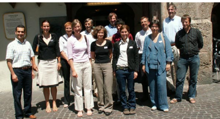
Ekipa projekta DIAMONT v središču Innsbrucka.