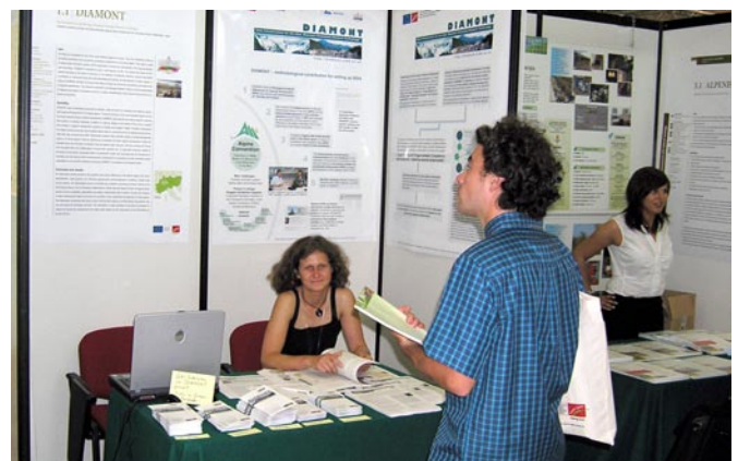
Lo stand di DIAMONT a Stresa.