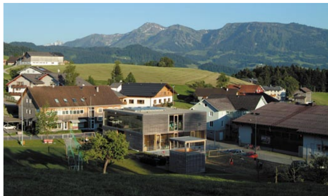
Il nuovo centro di Langenegg progettato dai cittadini e costruito utilizzando le risorse presenti in regione.

Risposta: In Dynalp 2 i membri della rete di comuni mettono in atto i risultati del maggiore progetto di trasferimento della conoscenza “Futuro nelle Alpi” realizzato dalla CIPRA. Due comuni austriaci ad esempio hanno deciso di dedicarsi alle pressanti questioni in materia di traffico, uno dei sei principali argomenti del progetto della CIPRA. Mentre il comune di Werfenweng nel Salzburger Land punta ad un turismo libero dalle macchine, il comune di Ludesch nel Vorarlberg